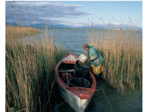
Avant la pêche

D'un point de vue floristique, 742 espèces ont été recensées, dont 14 sont considérées comme rares, à l'exemple de l'orchis à fleurs lâches, de l'œillet de Catalogne et d'un géranium sauvage. Plusieurs milieux se distinguent : de petites roselières côtoyant des enganes* (prairies à salicornes), des prés où croissent fêtuques et lavandes de mer, des vasières couvertes de juncs et quelques marécages ayant échappé au drainage du passé. On peut ainsi estimer la salinité des eaux selon la nature des espèces qui se développent sur les rives. Le long des digues et des chenaux, des arbustes et des haies de tamaris donnent parfois au paysage un aspect bocager.