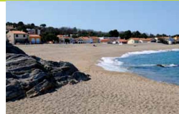
La plage du Racou à Argelès-sur-Mer.

8 Descendre dans l'anse de la Mauresque avant de remonter à flanc de butte. Au sommet, descendre vers la zone portuaire. Par une rue à droite, gagner les quais de Port-Vendres, puis la place de l'Obélisque ( 9 ).