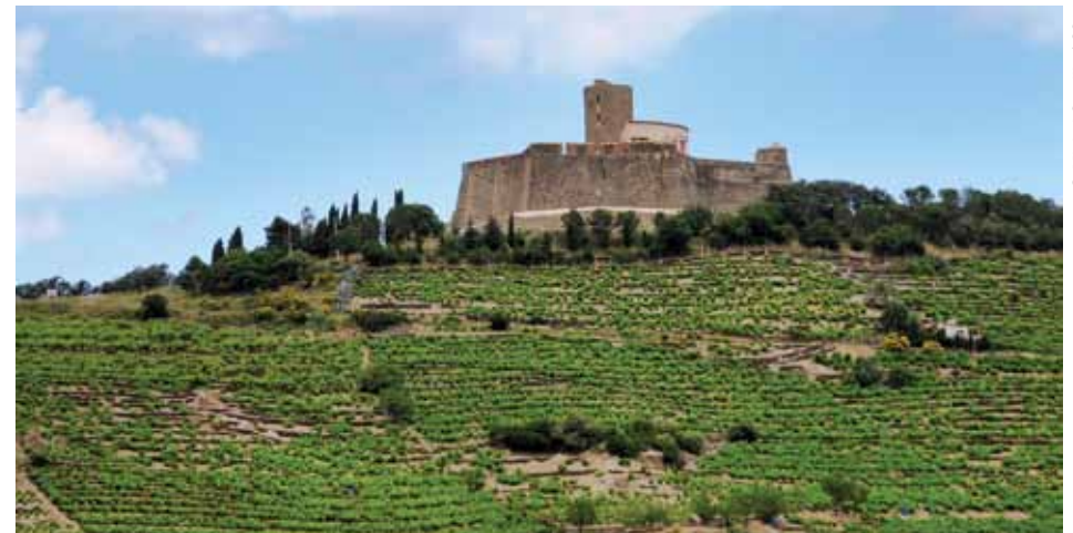
Le fort Saint-Elme domine Collioure.